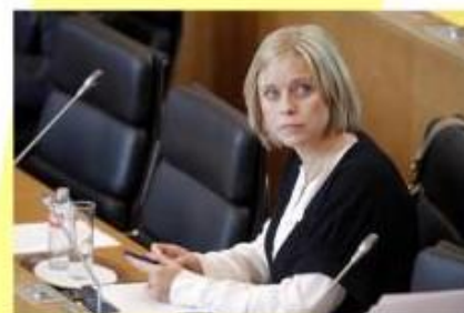
Au Parlement, où la Ministre répond aux questions des députés et expose ses politiques