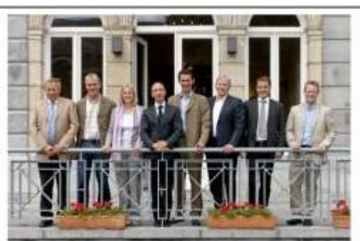
Le Gouvernement wallon Photo de famille