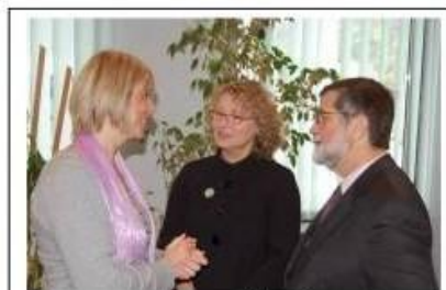
Rencontre avec la Ministre québécoise en charge des Aînés