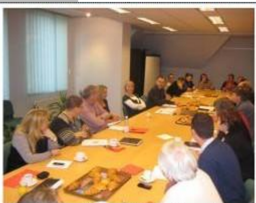
En réunion d'équipe le lundi matin au cabinet, rue des Brigades d'Irlande à Jambes