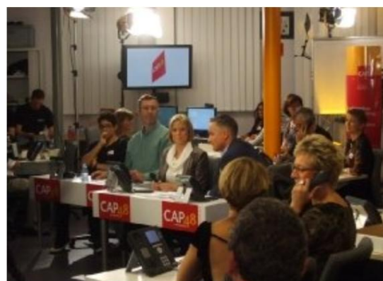
Au centre de promesses de dons CAP 48