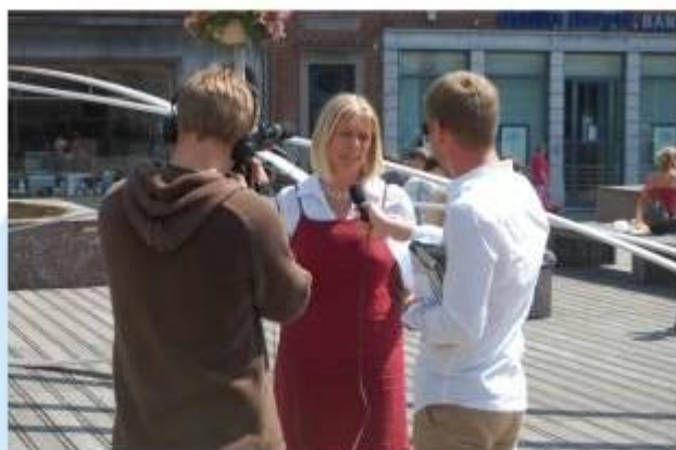
En interview dans le centre de Namur