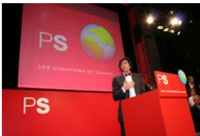
Elio Di Rupo lors du lancement des « Chantiers de demain » à Gembloux.

Dans ce cadre, chaque fédération du PS a organisé 2 soirées de débats comprenant 5 ateliers thématiques. A l'issue des rencontres, les propositions qui peuvent se concrétiser à l'échelon fédéral seront intégrées au programme du PS pour les élections législatives du 10 juin prochain. Autrement dit, chaque participant des « Chantiers de demain » aura donc la possibilité d'influencer directement le programme PS 2007 !